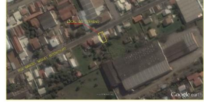
Imagem de Localização

PROJEÇÃO UNIVERSAL DE MERCATOR DATUM - SIGAS 2000 : Hemisfério Sul/Oeste MERIDIANO CENTRAL: - 51° WGr - Fuso 22 Marco M1 Latitude: 28°28'20.4838" S Longitude: 49°01'48.2514" W UTM: N= 684889.494 UTM: S= 692858.215 Fator Escala: 1.00075290 Altura Ortométrica: 14,26 Data: 22/12/2020 Convergência Meridiana (c) = - 0°56'21,931431" Declinação Magnética : -18°22'.Var. anual = -8,5'ano